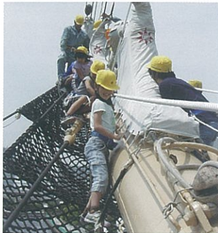
バウスプリット渡り