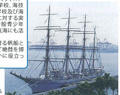
棧橋に係留中の海王丸