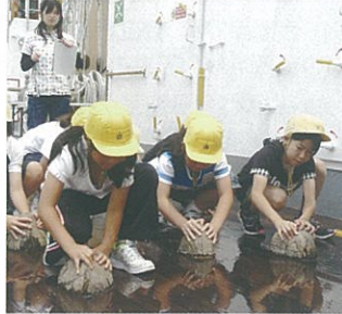
ヤシの実でデッキ磨き