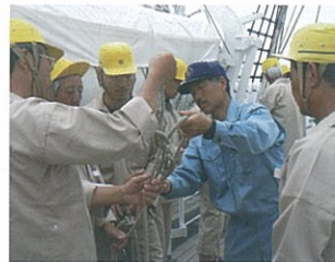
ロープの結び方と取扱い