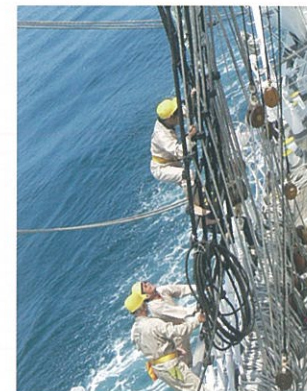
シュラウドからマスト登り