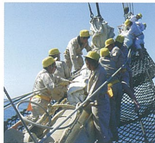
バウスプリットでの作業